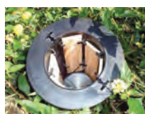
station enfouie au sol