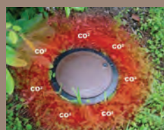
l'effet du Co2

Le Focus produit du Co2 ce qui a pour effet d'attirer les termites. Les termites associent le Co2 à une promesse d'un repas de fête. Peu importe s'ils sont sur d'autres bois, ils foncent dessus inexorablement.